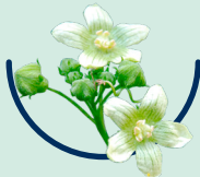
Bryonia D2 Zaunrübe