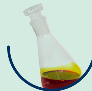
Ferrum sesquichloratum solum D2 Eisen-(III)-chlorid Lösung