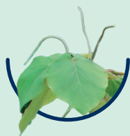
Piper methysticum Rauschpfeffer