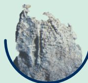
Argentum nitricum Silbernitrat