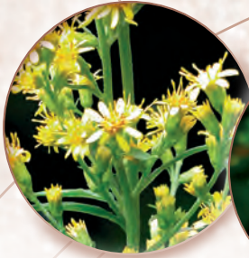
Goldrute Solidago virgaurea