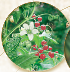
Zaunrübe Bryonia dioica