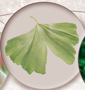
Tempelbaum Ginkgo biloba