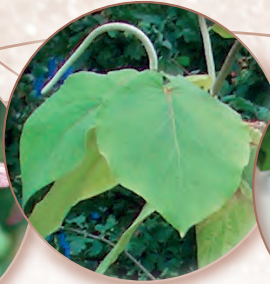
Rauschpfeffer Piper methysticum