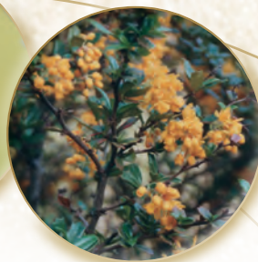
Berberitze Berberis vulgaris

krankungen, besonders mit Erschöpfung. Ergänzend finden wir noch das Grippe- und Kopfschmerzmittel Gelsemium sempervirens und das Schnupfenmittel Luffa operculata in dem Rezept. Erschöpfung ist auch der Grund für die weiteren Zutaten wie Milchsäure, zur Verbesserung der humoralen Stoffwechsellage und dem Gelben Enzian, den man einerseits im Gebirge als Nachbar von Eisenhut und Germer findet, der aber andererseits auch als Bittermittel die Entgiftungsfunktionen der Leber verbessert, um Immuntoxine auszuscheiden. Man könnte auch sagen, dass die drei Gebirgspflanzen mit ihrer Vitalität das Immunsystem wirksam unterstützen, um dem Erschöpfungszustand Herr zu werden, der einer Erkältung nahezu immer vorausgeht. Auch verhindert die Rezeptur durch die Anregung der Lebenskraft mögliche Rezidive. Das Immunsystem wird zudem auf spezielle Weise durch die Nosode Influenzinum angesprochen – daher eignet sich das Mittel sehr gut zur Resistenzsteigerung und zur Prophylaxe. Die anderen Bestandteile dienen dabei zur Drainage der durch die Nosode gelösten Toxine.