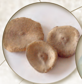
Brechnuss Nux vomica