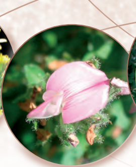
Hauhechel Ononis spinosa