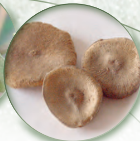
Brechnuss Nux vomica

Bei nervösem Magen, Stressgastritis, Sodbrennen und nervösem Durchfall sollte man an das Silberpräparat metanuxvomica denken. Neben den Nachtschattengewächsen Belladonna und Mandragora enthält es das Pfeilgiftgewächs Nux vomica, drei Kardinalmittel zur Behandlung einer funktionellen Dyspepsie mit krampfhaften Schmerzen und Gastritis. Das Bittermittel Wermut und die Gewürzpflanze Basilikum wirken Dank ihrer ätherischen Öle entspannend auf die Magenfunktionen.