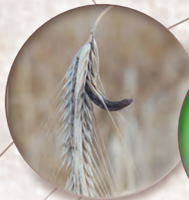
Mutterkorn Secale cornutum