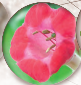
Virginischer Tabak Nicotiana tabacum