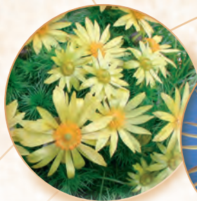
Adonisröschen Adonis vernalis