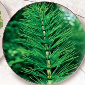
Ackerschachtelhalm Equisetum arvense

und melancholisch, also ganz in einem Saturnprozess gefangen.