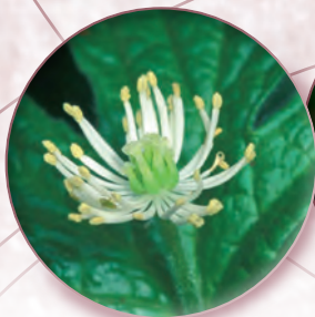
Kanadische Gelbwurz Hydrastis