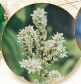
Weißer Germer Veratrum album