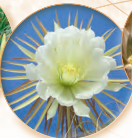
Königin der Nacht Cactus