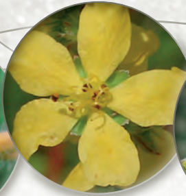
Odermennig Agrimonia eupatoria