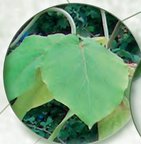
Kava Kava, Rauschpfeffer Piper methysticum