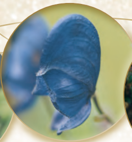
Blauer Eisenhut Aconitum napellus